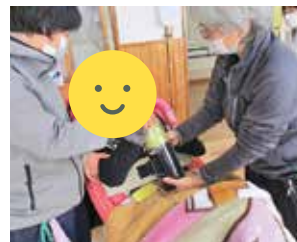
肢体不自由部高等部での取組の様子