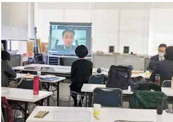
講演後介護報酬について質疑応答

普段触れることが少ない情報をご教授いただき、今後は事業部の枠を超えて連携をしていかなければならないと痛感しました。