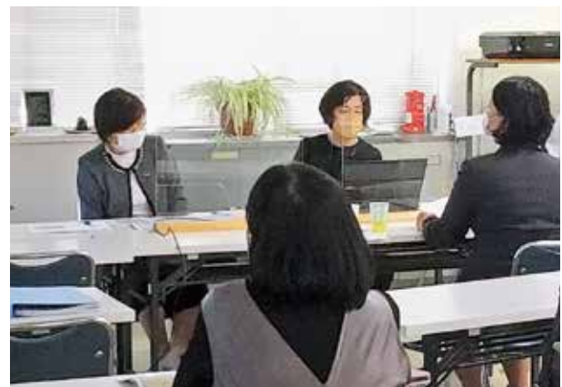
医療報酬について意見交換