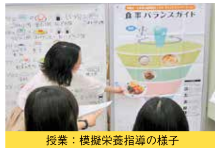
授業：模擬栄養指導の様子