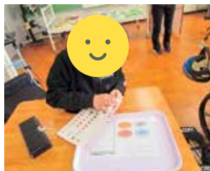
肢体不自由部中学部での取組の様子

肢体不自由部高等部の社会生活の授業において、調理場でペースト食を作る様子の動画視聴や、ペースト食の調理の実演を行いました。前時の授業において、生の食材をミキサーにかけて作ったものの香りや見た目を確認し、いつも食べている給食と違うということに気付きました。この授業の中で、出来上がった給食をミキサーにかけて、ペースト食を作る実演を行いました。ミキサーの音や振動、出来上がったペースト食の香りなどを確かめることで、生徒たちも、ペースト食ができる過程について学ぶことができました。生徒は給食に関する興味関心を高め、感謝の気持ちを持つことにつながりました。