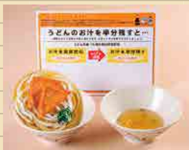
～減塩指導～ うどんのお汁を半分に残すと…

ご利用の際は栄養士会事務局まで お申込みをお願いします。 郵送の場合は送料をいただきます。