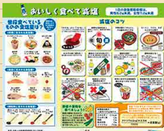
減塩タペストリー

ご利用の際は栄養士会事務局まで お申込みをお願いします。 郵送の場合は送料をいただきます。