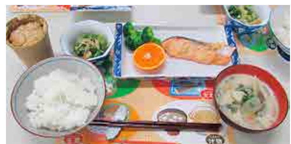
野菜たっぷりメニュー

私が最初に赴任した保健所は、調査で実態を把握して事業を展開するところでした。これからも情熱を失うことなく、住民の暮らしを見つめ、食の実態を把握したうえで、地域の住民や栄養委員の皆様のお役に立てる仕事に取り組んでまいりたいと思います。