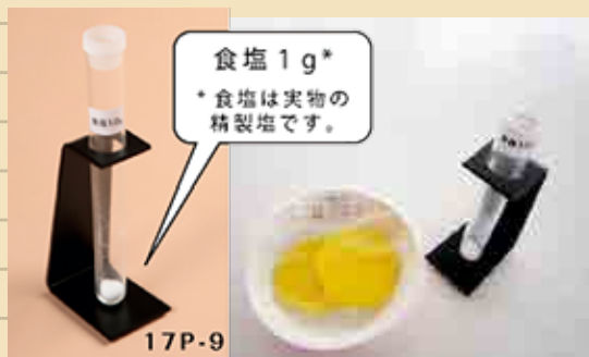
塩分1gの食品 (たくあん、食塩1g)